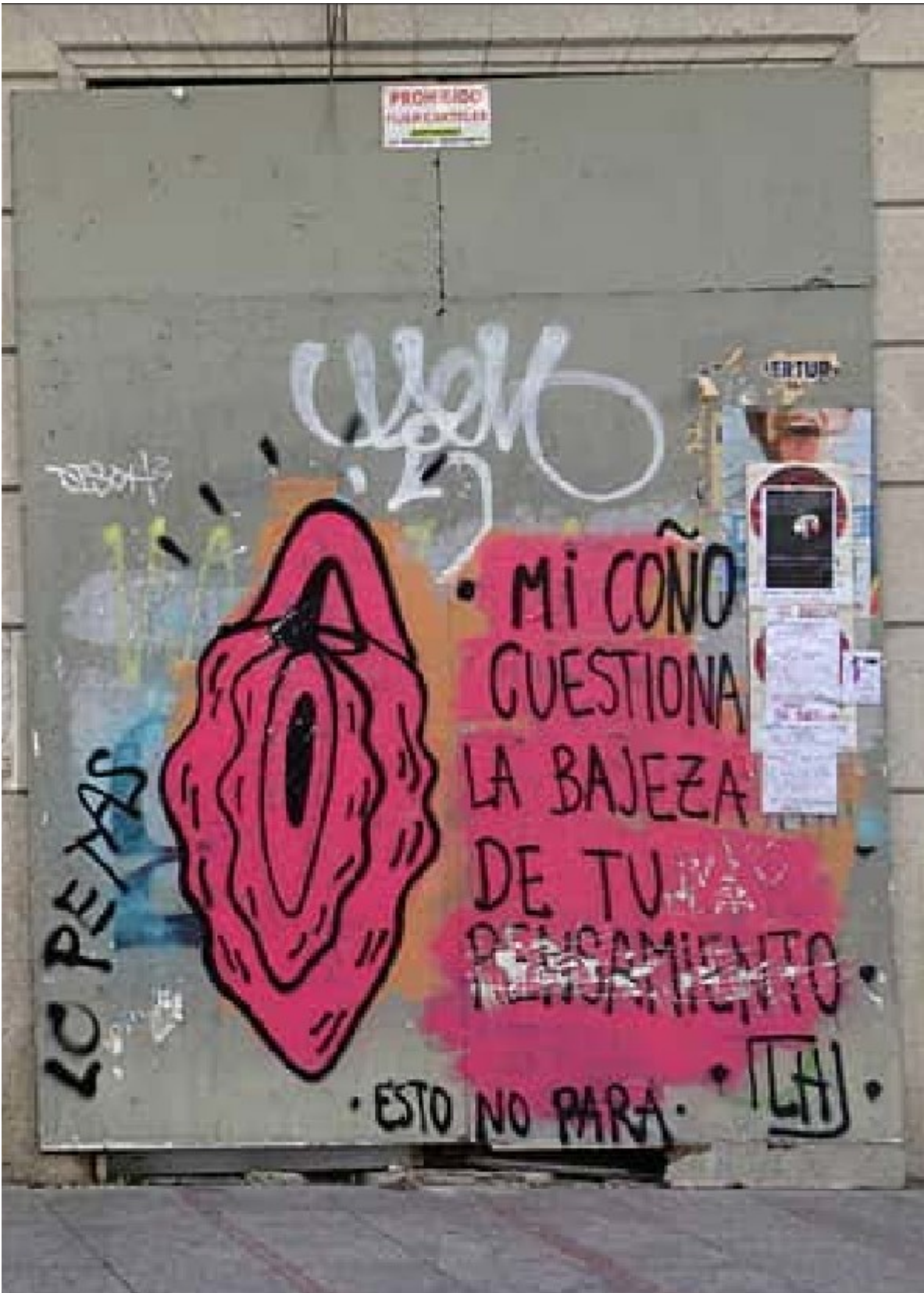
Graffiti de Lupita Hard